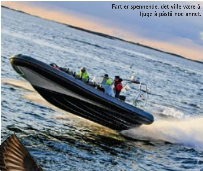
Fart er spennende, det ville være å ljuge å påstå noe annet.