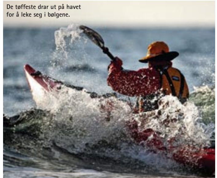
De tøffeste drar ut på havet for å leke seg i bølgene.